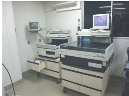
\gamma 線・ \beta 線測定装置