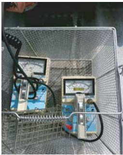
空間放射線量測定器