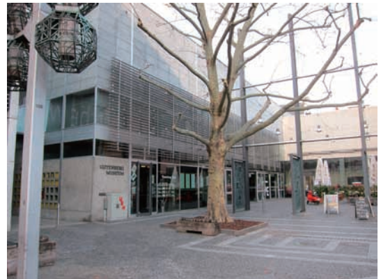
グーテンベルク博物館

印刷に興味がある人は必見の博物館ではあるが、そうでもない人は、マインツの街歩きをした方がよいかも。隣にあるミュージアムショップは、狭いものの、扱っている商品は面白いものが多い。（大矢一志）