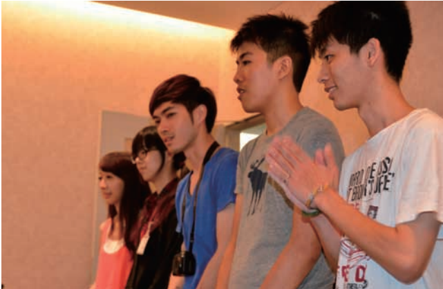
歓迎パーティーにて

今回の経験を通じて、もう一度、日本を訪問したいと思うようになりました。また、ぜひ、みなさんが台湾の世新大学を訪問して頂けることを期待しています。