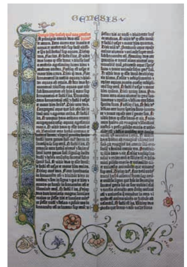
42行聖書（紙ナプキン）

アクセス：Mainz 駅から、約1km。歩いて10-15分くらい。ちなみに、博物館の裏手には細い路地の商店街があり、面白い。