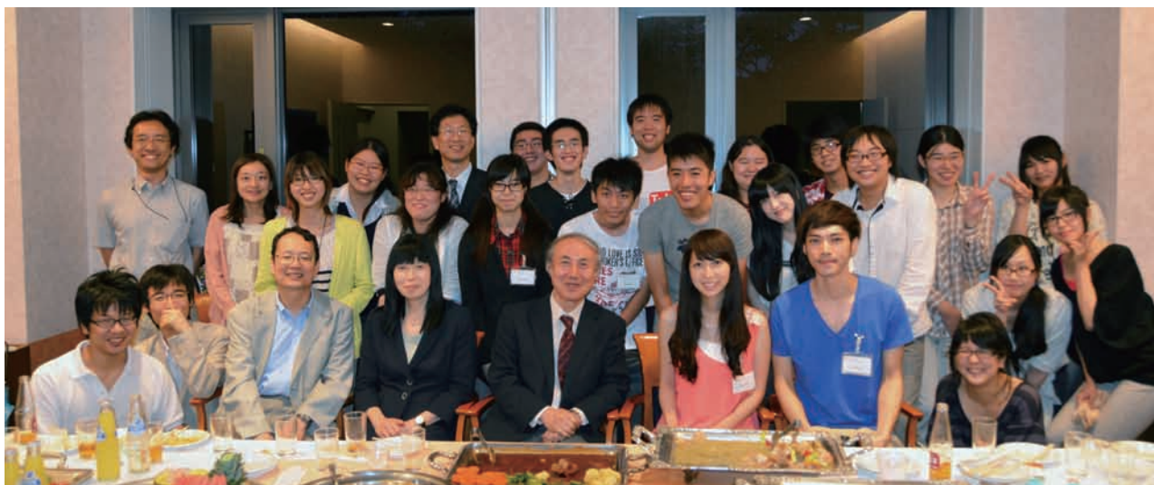
世新大学の研修生の歓迎パーティー