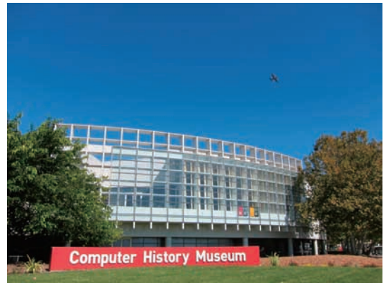
計算機歴史博物館

旅行のガイドブックには載っていないかもしれない。また、アクセスも良いとはいえないが、訪問する価値はあると思う。ショップも充実している。(大矢一志)