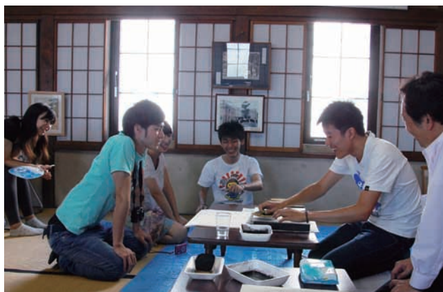
塙保己一史料館での版木摺り体験

鶴見大学の学生と友人になれ、色々なところに案内してもらえ感謝しています。今度、来日するときまでに日本語をもっと話せるように勉強したいです。他の国の学生とともに学ぶことで多くのことを得ることができました。