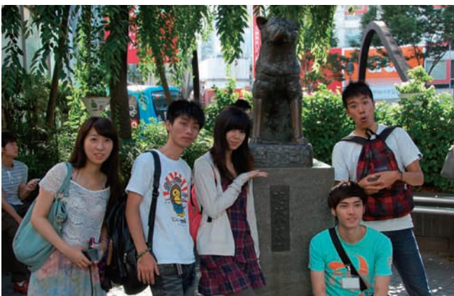
渋谷ハチ公前にて