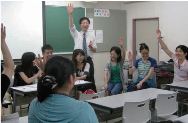
ドキュメンテーション学科の学生と

また、街の自動販売機の中には、購入する人を認識して、音声で対話する形式のものがあり、実際に体験することが出来、自分の研究テーマと関連が深く大変参考になりました。