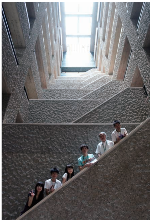
国立国会図書館にて