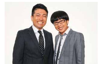
ラフ・コントロール

一般募集は「ペットコンテスト」。ご自慢のペットの写真を送ってください。投票で「かわいいペット」第1位には記念品が贈られます。前回から引き