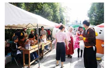
大学祭の大きな楽しみの一つ、模擬店が参道に復活。待ち遠しい賑わいの風景。写真は第55回紫雲祭(2019年)

まず、大きなニュースはコロナ禍で立ち消えになった参道での模擬店の復活。これがなければ、紫雲祭も盛り上がりません。4年間の空白期間に途絶えた模擬店開店のノウハウ。実行委員会の熱意が学生に届き、OBや先輩、学生支援課のサポートでいよいよ復活します。食欲をそそるフードと訪れる人、お迎える人の笑顔が2日間あふれます。